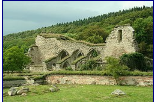
Klosterkyrkans södra sida

Alvastra kloster är ett före detta cisterciens kloster beläget vid Ombergs fot i Ödeshögs kommun. Det grundades 1143 av munkar från det franska klostret Clairvaux och var tillsammans med Nydala kloster det första cisterciens klostret i Norden. Alvastra kom i sin tur att grunda munkklostren Varnhem, Julita och Gudsberga och Alvastras abbot fungerade dessutom tidvis som faderabbott åt nunneklostren Askeby, Vreta och Riseberga. Klosterlivet varade utan kända avbrott tills klostret upplöstes omkring 1530 i samband med reformationen. Numera finns bara ruiner kvar av kyrkan och de övriga klosterbyggnaderna.