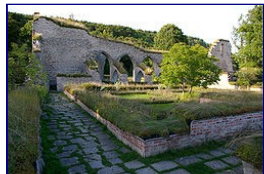
Klosterkyrkan och klostergården sedda från hörnet mellan västra och södra korsgången

Munkarnas refektorium som kommer närmast har måtten 14,5 x 7 meter och är mycket dåligt bevarat. Här intog munkarna sina måltider, vilka tillagades i det intilliggande köket. Från köket nådde man lätt lekbrödernas refektorium i den västra klosterlängan, som i sin helhet