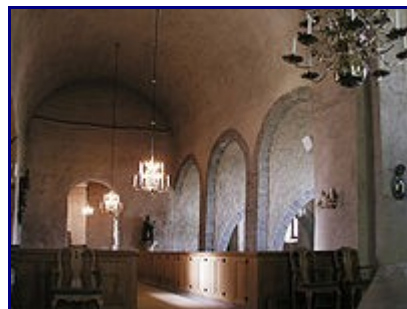
Heda kyrka. Valven liknar de som en gång fanns i Alvastra klosterkyrka