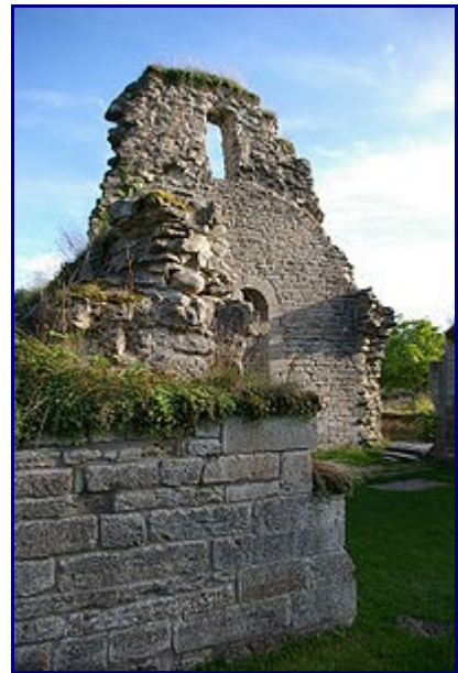
Södra tvärskeppet sett från presbyteriet

Det nordligaste utrymmet i den östra klosterlängan utgörs av den välbevarade sakristian, med ingång från det södra tvärskeppet. Rummet är omkring 4x7 meter stort och indelat i två travéer försedda med intakta kryssvalv. Sakristians golv befinner sig 65 cm under marknivå och rummet är väldigt mörkt, för det har bara en liten långsmal fönsteröppning mot öster. Vid utgrävningar har man hittat fundamentet till ett altare vid rummets östra vägg, vilket möjligen har varit helgat åt Johannes Döparen. Förutom att tjäna som förvaringsrum åt kyrkans heliga kärl och mässkrudar fungerade rummet troligen även som abbotens privata kapell. Söder om sakristian ligger kapitelsalen, vilken till skillnad från sakristian är mycket dåligt bevarad. Namnet kommer av att munkarna samlades här varje dag för att höra ett kapitel ur den helige Benedikts regel läsas upp. Man samlades även här för att diskutera klostrets angelägenheter och lyssna till viktiga meddelanden och det var också vanligt att klostrets abbotter blev begravda här. Rummet är cirka 7x12 meter stort och har varit indelat i två travéer, men eftersom endast grundmurarna är bevarade är det svårt att uttala sig mera noggrant om det ursprungliga utseendet. I östra änden har man i alla fall hittat