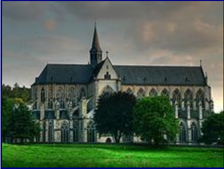
La cathédrale d'Altenberg.

Altenberg est situé dans le district d'Odenthal, dans l'arrondissement de Rhin-Berg, dans le land de Rhénanie-du-Nord-Westphalie en Allemagne.